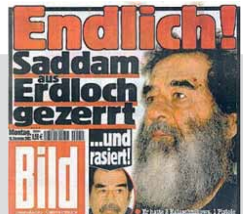
Bild vom 15.12.2003