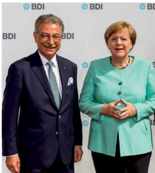
BDI-Präsident Dieter Kempf und Bundeskanzlerin Angela Merkel

Wer denkt jetzt nicht an den Bund zur Erneuerung des Reiches und dessen Themen und dessen Propagandaarbeit? Wenige Jahre später steht Henkel dann an der Wiege der AfD.