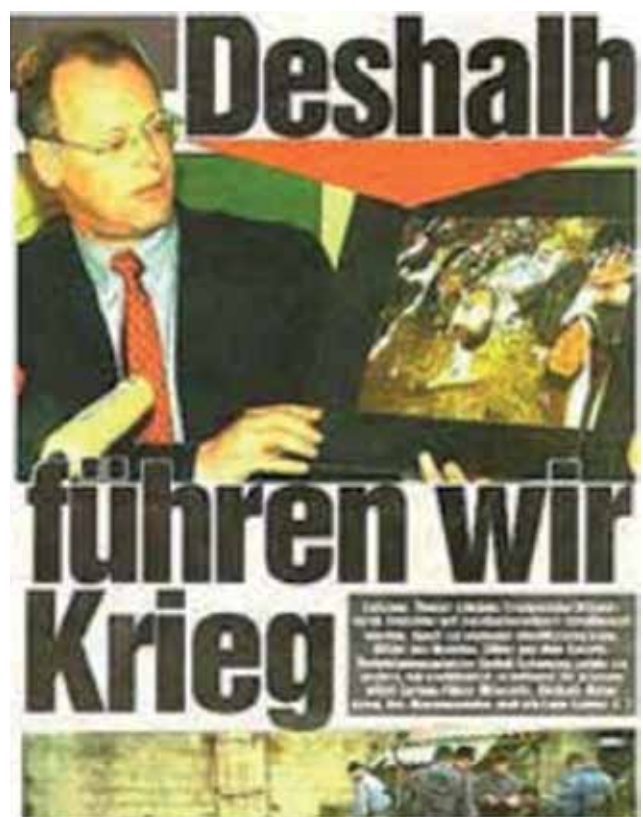
Express vom 28.4.1999